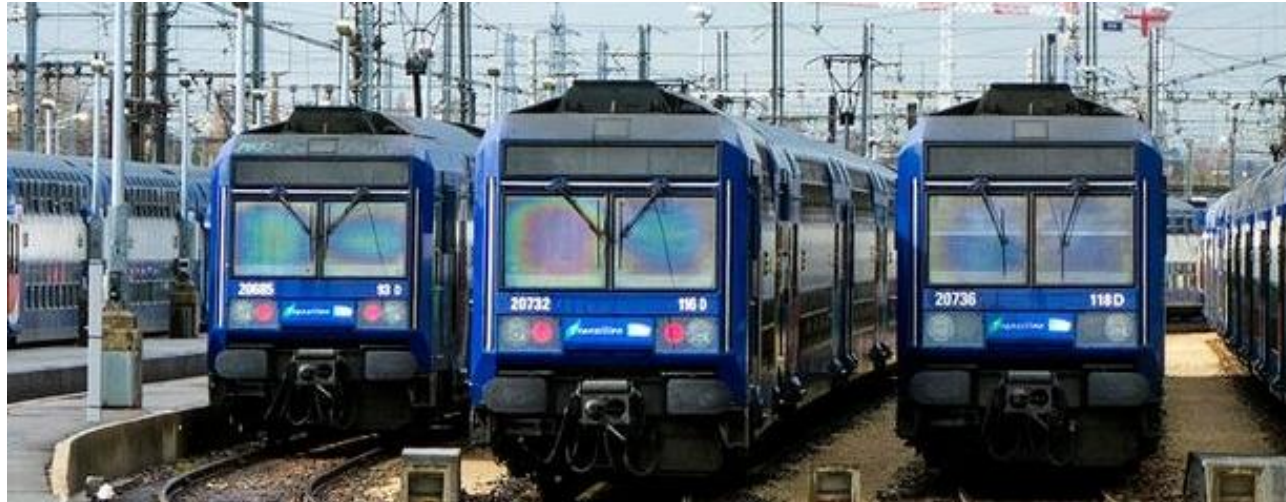
1 - Z20500 du RER D au garage de Villeneuve Saint Georges